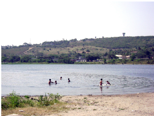
Imagem 02: Açude de Bodocongó: o lúdico convivendo com a tristeza da poluição